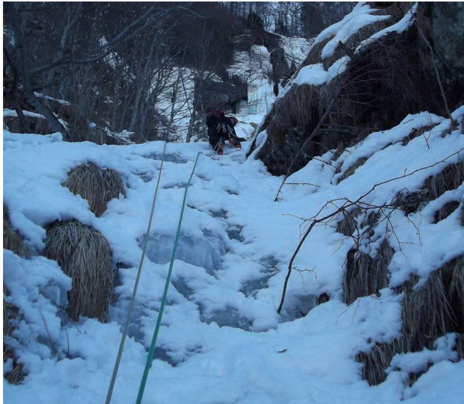
Trappo abbastanza appoggiato del 3° tiro (Foto marzo 2013)