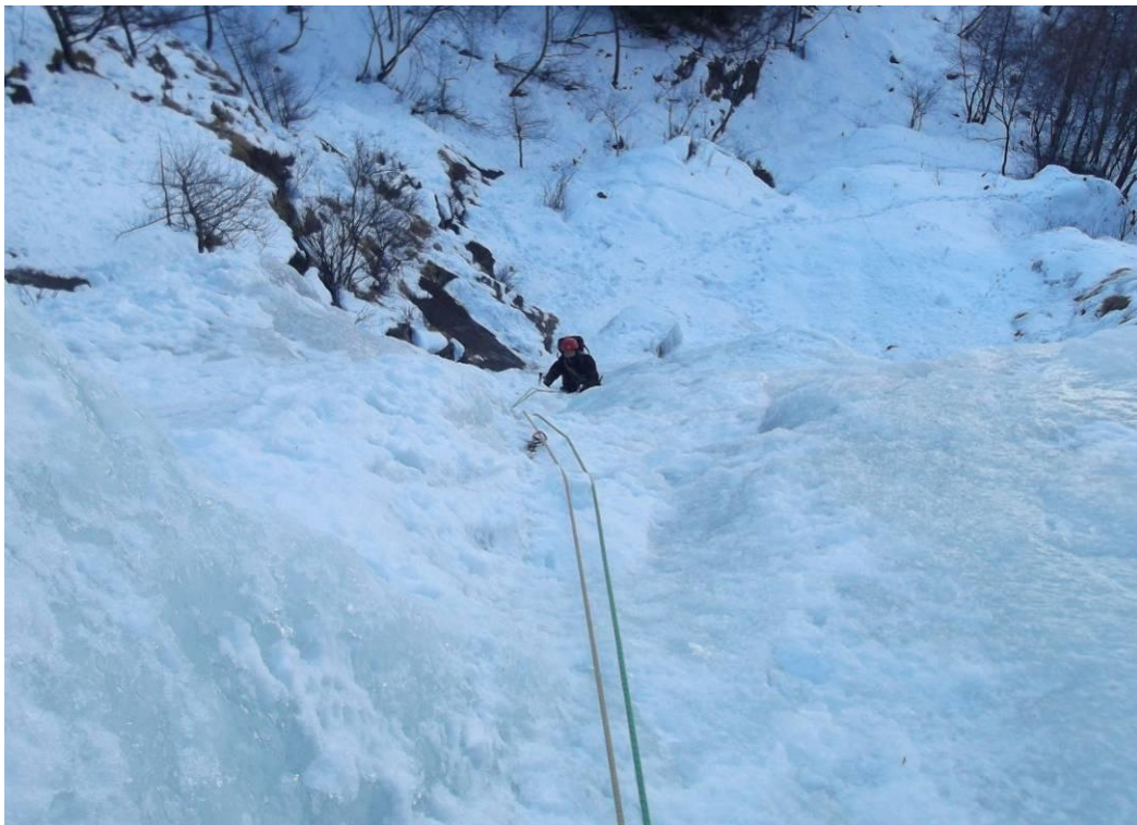
5° tiro visto dalla sosta (Foto marzo 2013)