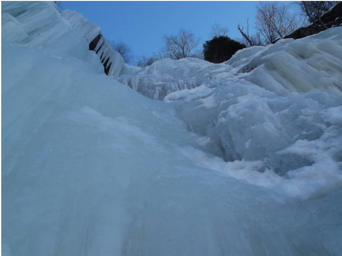
Partenza 6° tiro e ultimo tiro (Foto marzo 2013)