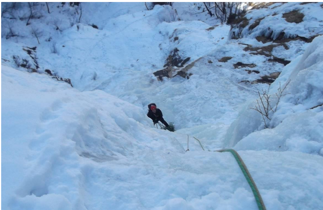
Oltrepassata la parte verticale del 6° e ultimo tiro (Foto marzo 2013)