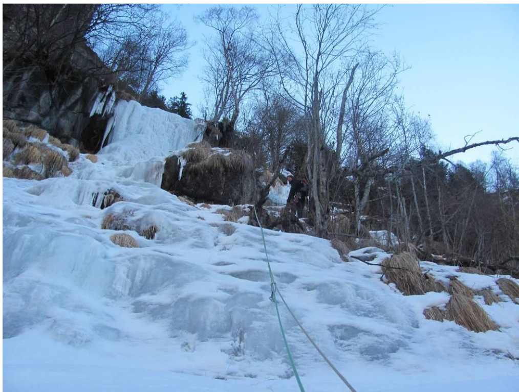
Prima sosta e a sinistra la paretina verticale che non abbiamo fatto per rientrare nella cascata Tornadri attraversando nel bosco a destra (Foto marzo 2013)