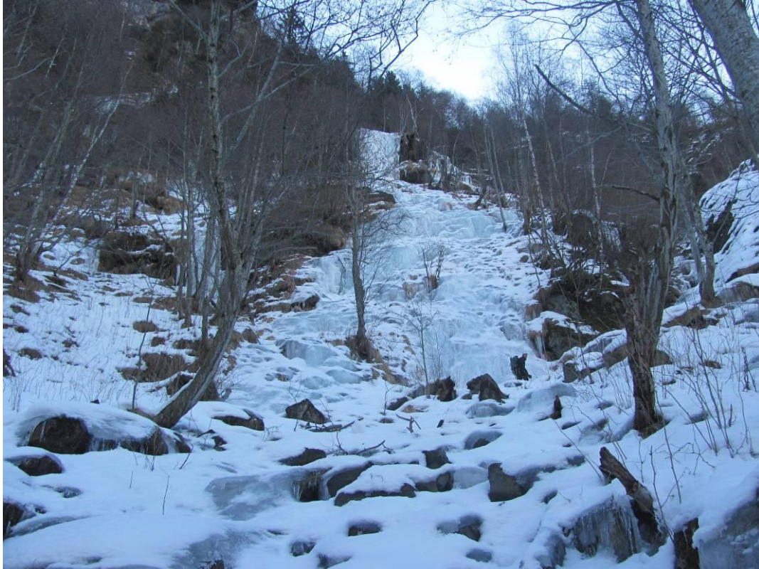
Primo muro della cascata al centro (Foto marzo 2013)