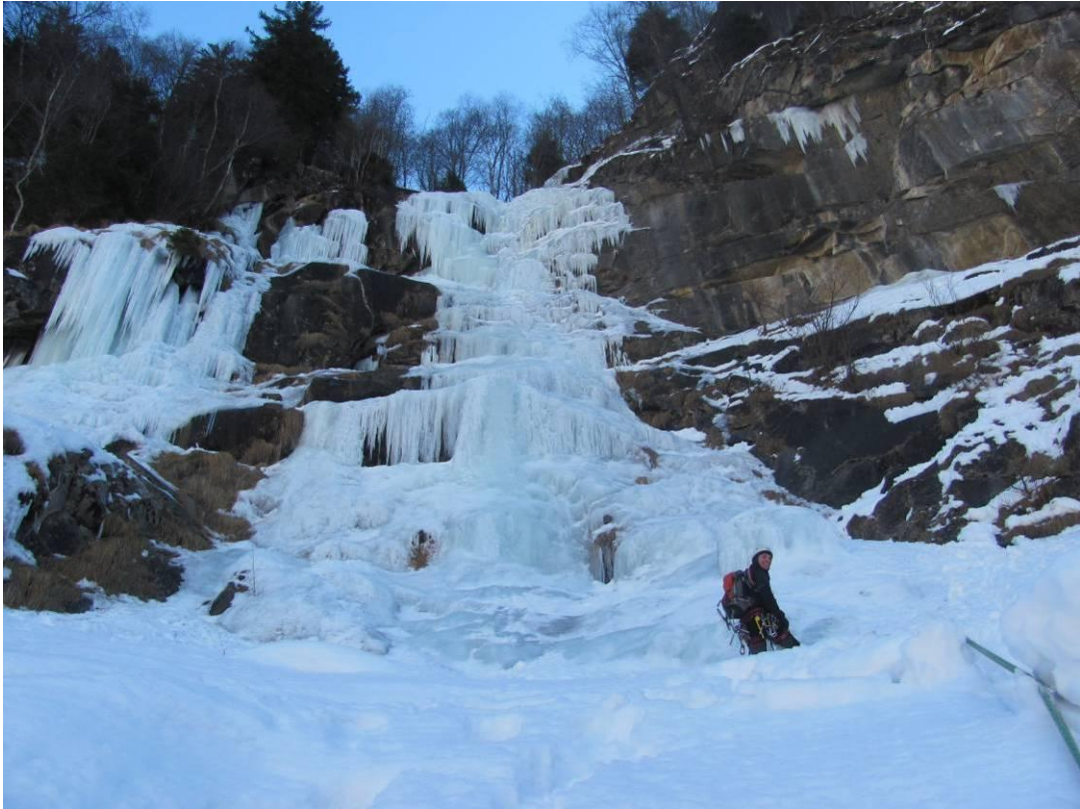
5°-6° tiro, il bel muro dei Tornadri (Foto marzo 2013)